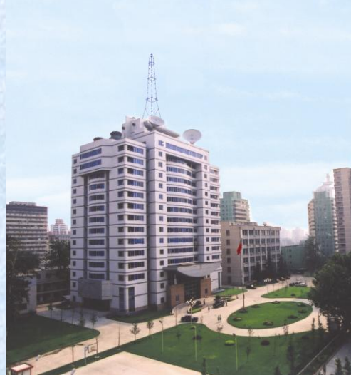
中心办公大楼和资料楼

1986 年中心获得硕士学位授予权，现有情报学、军事装备学和计算机应用技术三个硕士学位授权点，并与北京大学、军械工程学院等单位联合培养情报学和军事装备学博士研究生，具有以研究生毕业同等学力申请硕士学位授予权，设立了博士后科研工作站，是国防科技信息人才培养基地。