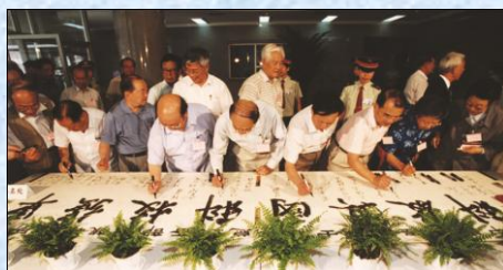
百位院士来中心视察