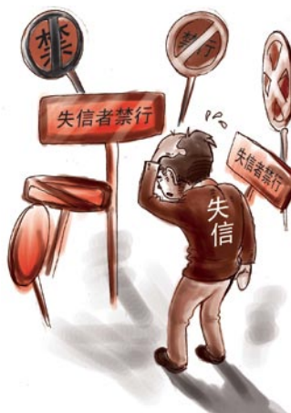
失信让我走进了死胡同

首先，中国人民银行征信中心出具的个人信用报告是对个人过去信用行为的客观记录，并不对个人的信用好坏进行定性的判断。不对欠款进行“善意”欠款或者“恶意”欠款的区分，是为了保证信息的客观性。其次，商业银行等个人信用报告的使用机构会根据个人的实际情况和其他信息对客